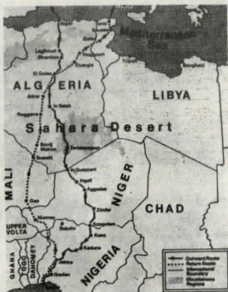
Et kort der viser de to ruter - syd- og nordgående - som blev fulgt på ekspeditionen gennem Sahara.

VI BRINGER ET UDDRAG AF EN ARTIKEL FRA BLADET: DANSKE VOGNMÆND NO: 11/77.