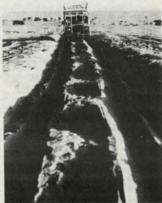
Det er barske forhold, der venter lastvognene nogle steder. Som her blot et par hjulspor i sandet. Alligevel mener man, at en fast Sahara lastvognrute er en praktisk mulighed.

Land-Roverne gennemkørte to forskellige ruter og mødte mange genvordigheder, navnlig hvad terrænet angik. Nogle steder