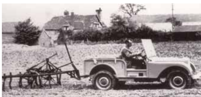
Højre: Prototypen med rattet i midten på landbrugsarbejde.

Land Roveren har været brugt til utallige ekspeditioner til mere eller mindre fremkommelige hjørner af vor klode. Der er ikke mange ekspeditioner efter anden verdenskrig, der ikke har kunnet gøre gavn af Land Rovers mange kvalifikationer. Mange mener ligefrem, at Land Rover har overtaget kamelens rolle som ørkenens skib.