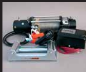
WARN TABOR 9K Før: 6.210 kr. Nu: 4.750 kr.

Husk at tilmelde dig vores nyhedsmail, så bliver du holdt orienteret om alle vore spændende nyheder og gode tilbud