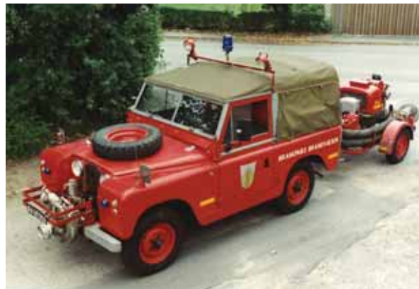
Højre: Bramsnæs Brandvæsens Land Rover