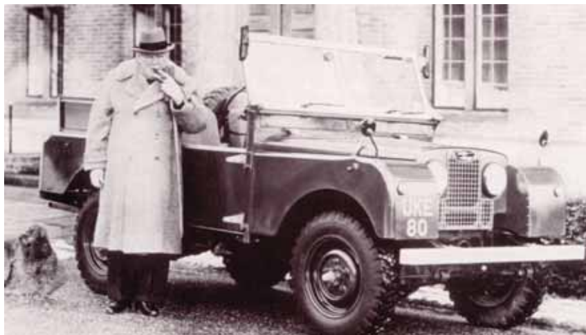
Øverst: Sir Winston Churchill fik en 86" Land Rover til sin 80 års fødselsdag

Som nævnt har Land Rover været brugt i utallige sammenhænge og lige fra starten kunne mange landes militær se fordelene ved den meget anvendelige englænder. Det var både ombyggede civile udgaver og militære specialmodeller, der fandt vej til verdens brændpunkter og mange landes beredskabslagre. Mange husker sikkert de specielt pansrede udgaver, som politistyrkerne i Irland brugte.