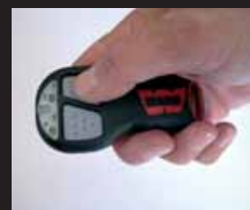
WARN trådløs fjernbetjening Normalpris: 2.125 kr. Nu: 1.695 kr.