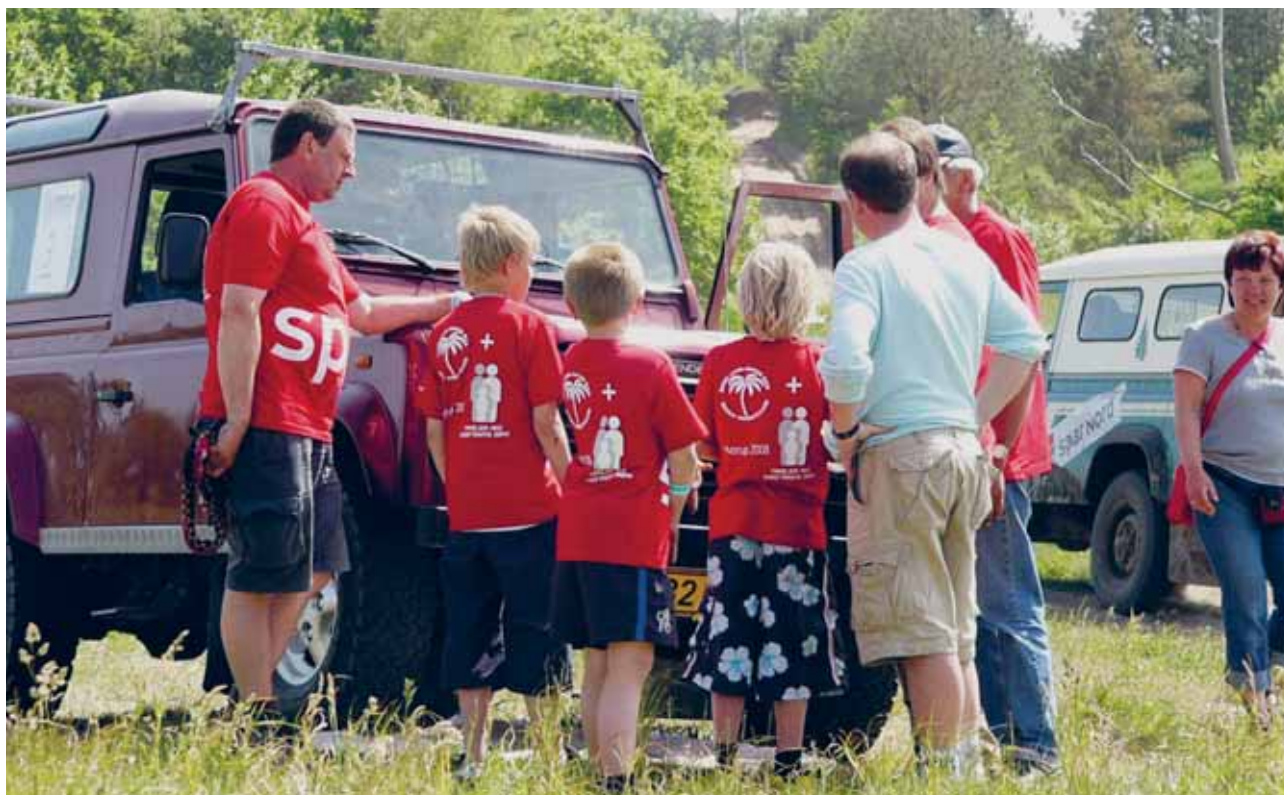
Børnene informeres inden du skal udføre gymkana opgaver. Hvorup 2008 (fotograf: Helge Oscar Kallehaug + #1821, reg. nyl)