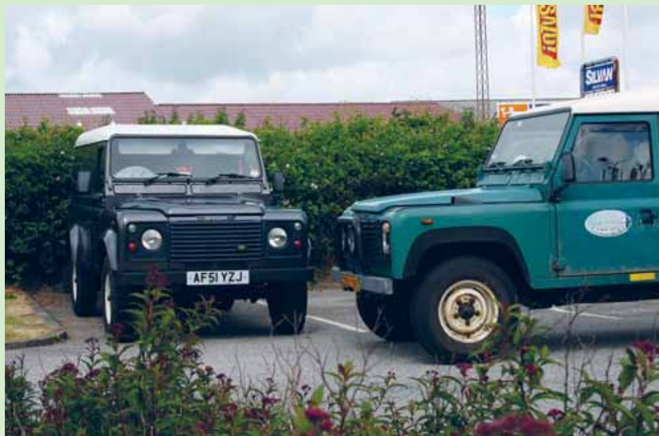
"Vi mødtes tilfældigt, i solens skær...! Turistbyen Ribe tiltrækker også firhjulstrækkere. Stampemøllen, Ribe

Vores kontaktmail info@la2008.dk er åben lidt tid endnu, og vi håber, at så mange som mulig vil benytte muligheden for at give os lidt feed-back, som vi