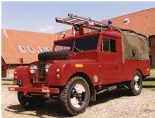
Venstre: Lemvig Brandvæsen

Den største klub i Danmark er Dansk Land Rover Klub ( www.dlrk.dk ) med næsten 2.000 medlemmer og mere end 30 år på bagen. Dansk Land Rover Klub har sin egen sektion for de gamle Land Rovere, veteranregistret, hvor den ældst registrerede bil er fra 1949. Dansk Land Rover Klubs veteranafdeling blev grundlagt på klubbens landsråd 1991, hvor det blev foreslået, at man lavede en afdeling for de gamle biler. Klubbens kriterie for en veteran var "Dem med uret i midten", (dog ikke lighthweighth), men altså serie 1 og serie 2. ( de køretøjer som er producerede fra 1948 frem til 1972 ). Der blev oprettet et veteranregister, som registrerede alle de medlemmer, der ejede en af " dem med uret i midten" eller rettere, dem som fandt, at det var en god ide at brede interessen for disse. I 2006 ændrede man optagelseskriteriet til bilen er 35 år eller derover.