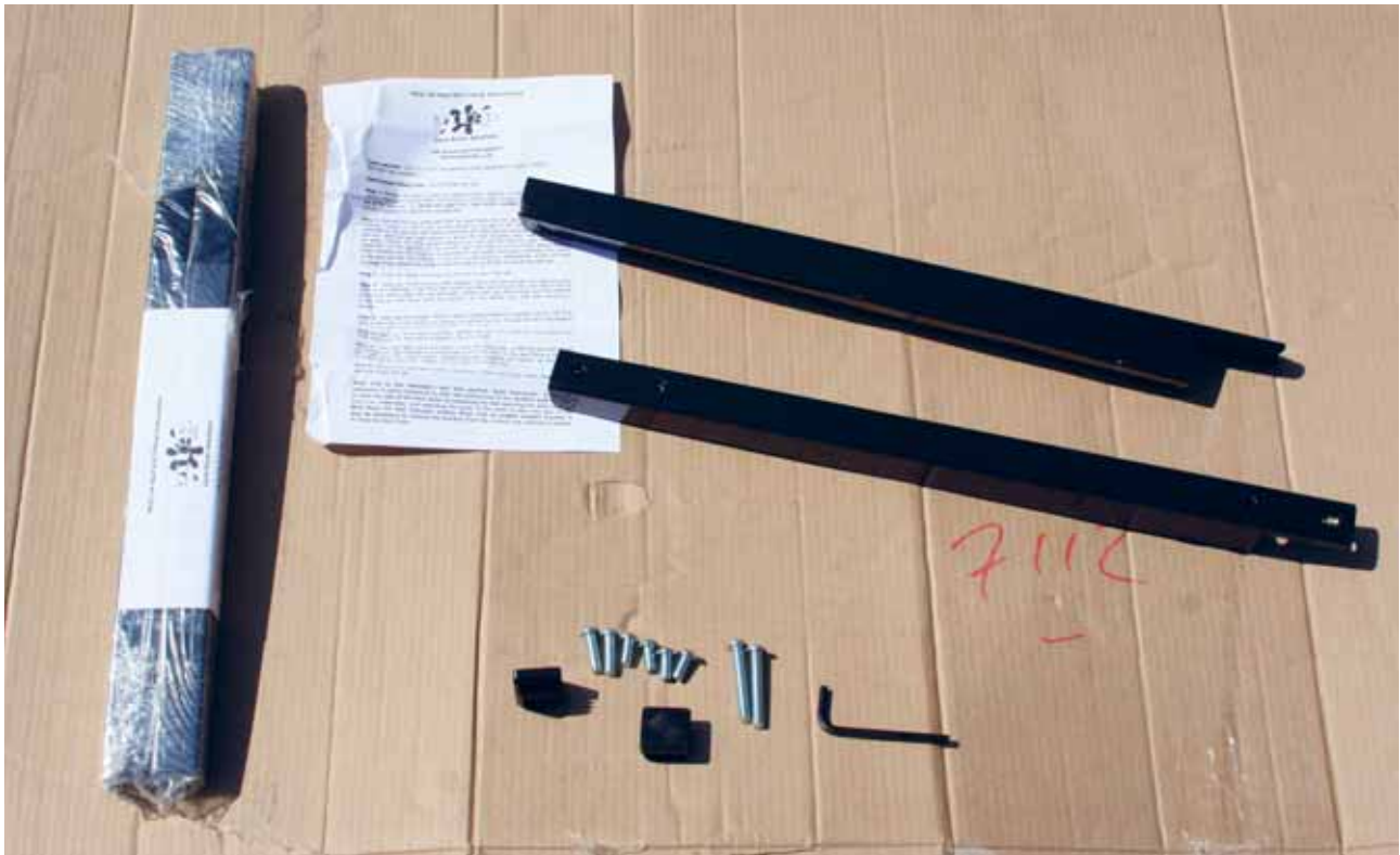
Hvad pakken til venstre indeholder