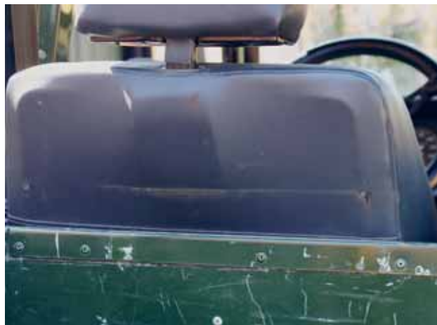
Bemærk højdeforskellen i slidmærket

Og hvilken forskel det giver i siddestillingen! Nu er det lige før jeg skal have sædet et hak frem, og jeg har opdaget, at der rent faktisk er lår støtte i et standard Defender sæde. At man hæver sædet 5 cm giver ikke mig problemer med hovedhøjden, men