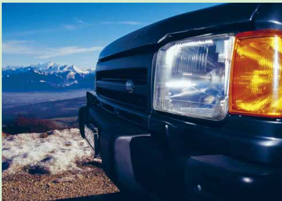
Vores schweiziske V8 Disco med Mont Blanc i baggrunden en forårsdag i 2005. Le Saleve - Genève

19. oktober Greenlaning, Turen er ikke helt tilrettelagt endnu.