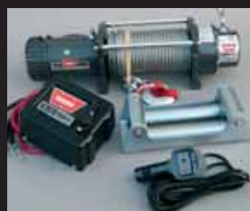
WARN 9.5XP Før: 12.625 kr. Nu: 9.600 kr.