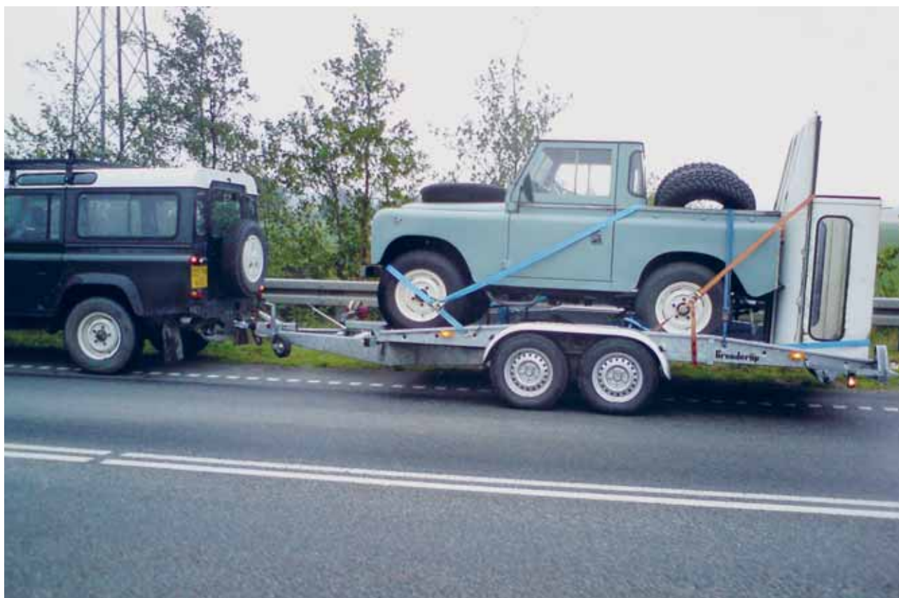
Så tæt på Wales, så skal man også besøge Black Mountans. Black Mountans Wales 2008