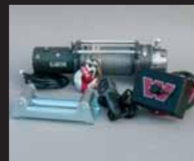
WARN XD9000 Før: 11.094 kr. Nu: 8.400 kr.