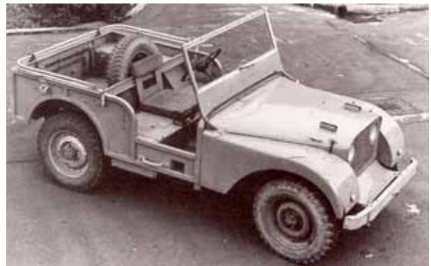
Den originale Land Rover prototype fra 1947 havde rat og ratstamme placeret i midten. Udseendet mindede mere om Jeep'en end de efterfølgende produktionsmodeller.

En af brødrene ejede en landbrugsejendom, hvor han i mangel på en traktor brugte en ældre jeep fra krigen. Den var efterhånden blevet noget slidt og forfalden, og den trængte til at blive skiftet ud, eller i det mindste til en omfattende reovering. Chefdesigneren vidste godt, at det var umuligt at skaffe reservedele til bilen, uden han købte et større parti, og nye jeeps kunne på det tidspunkt ikke eksporteres fra USA.