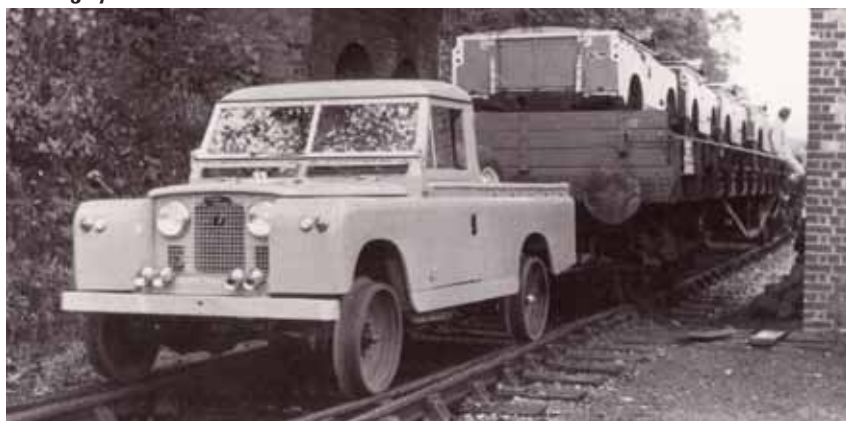
Man prøvede Land Rover i utallige sammenhænge, her en serie 2A 109" som prøvemodell.

Efterspørgslen af Land Rover blev ikke mindre af, at den nye model kom på markedet, men kunderne begyndte at efterspørge en større motor og en dieseludgave.