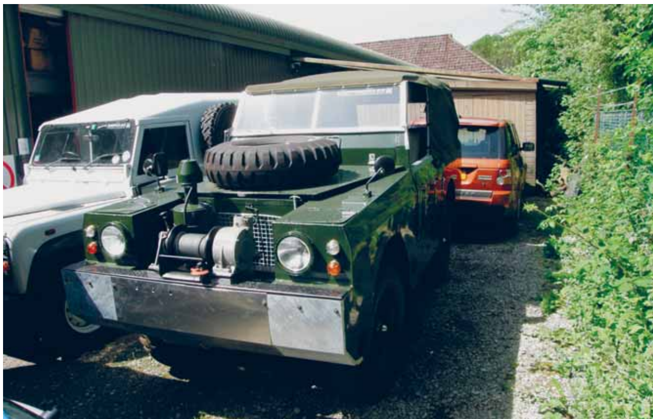
Når man ny er der, så måtte vi også forbi Dunsfold for at rode i stumper, og se på en del af deres collection, bl.a. denne LR, der efter sigende kan sejle på vandet. Dunsfold, Surrey 2008