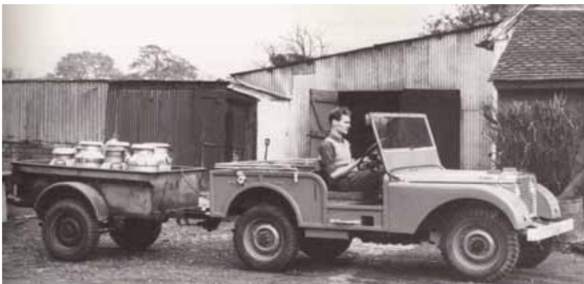
Land Rover var oprindeligt tiltænkt landbruget. Her en af de første prototyper.