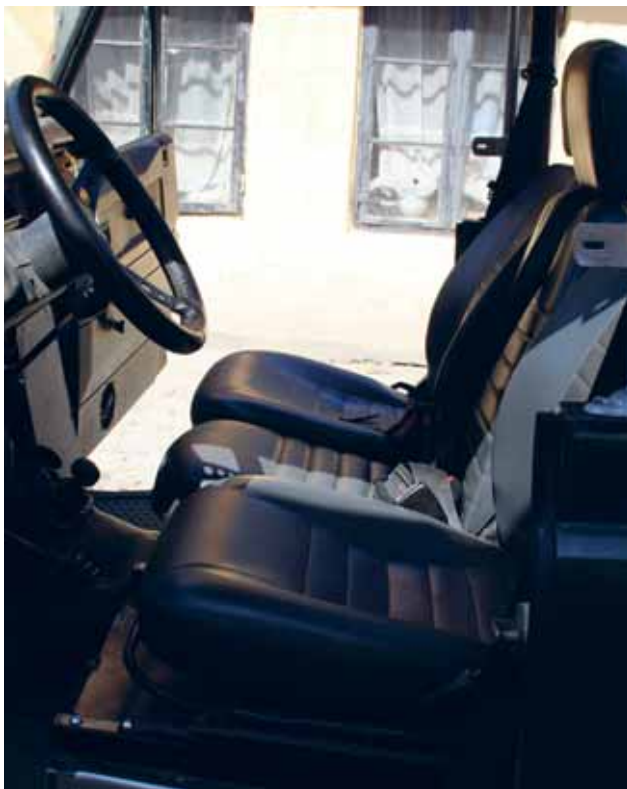
Førersæde med, og passagersæde uden

man skal lige vænne sig til at udsynet af sideruderne bliver begrænset at dørrammen, og albuepladsen i sidedøren er ændret en del, men ikke noget der giver problemer. Det er også blevet lidt besværligere at lukke selen, nu hvor låsen næsten flugter med sædet.