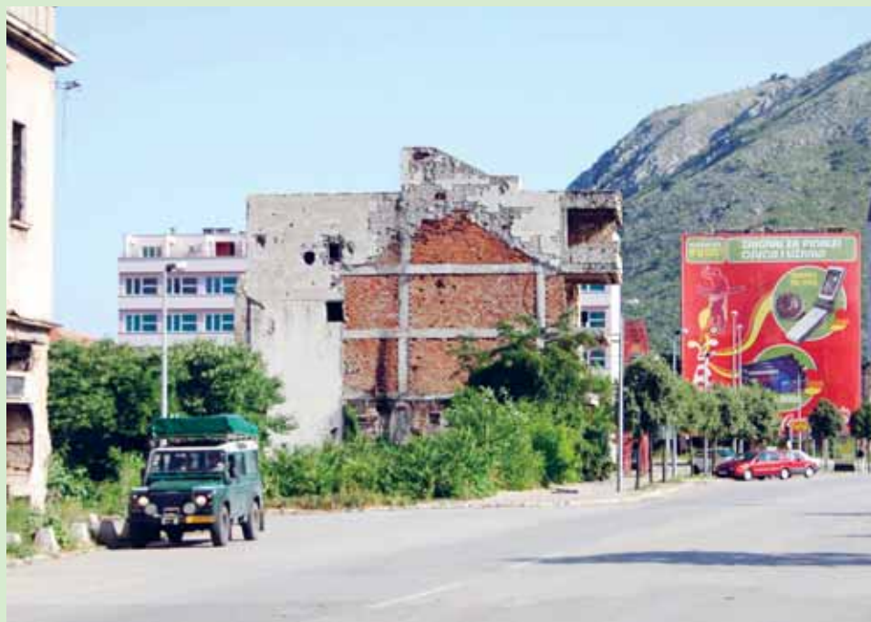
God sommer til alle fra Mostar i Bosnien Herzegovina. Mostar